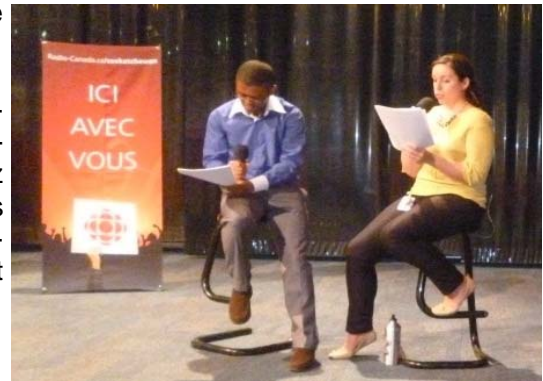
Par Gilbert Havugiyaremye

Aux jeunes et adultes passionnés par l'écriture en français, gardez vos plumes et rendez-vous à la Grande Dictée 2014. Individuellement ou collectivement, vous pouvez soutenir cette initiative d'enrichir et de préserver le français dans notre province en nous faisant parvenir vos suggestions, par vos commandites, en annonçant l'événement dans votre communauté et en participant à l'événement.